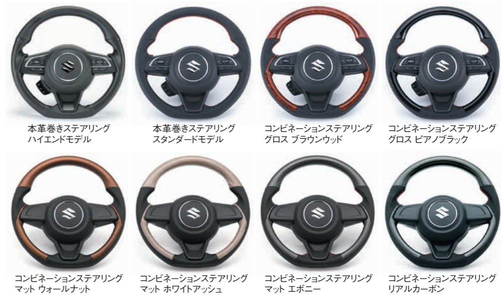
本革巻きステアリング ハイエンドモデル

※1 ベースボールステッチはハイエンドモデルのみ。 ※2 ヨーロピアンステッチはコンビネーションモデルのみ。