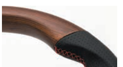
コンビネーションステアリング レッドステッチ