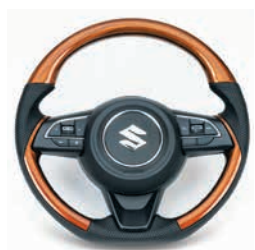
コンビネーションステアリング グロス ウォールナット