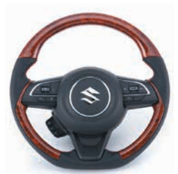
コンビネーションステアリング グロス ブラウンウッド