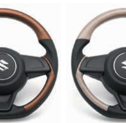
コンビネーションステアリング マット ホワイトアッシュ