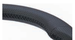
本革巻きステアリング ブラックステッチ