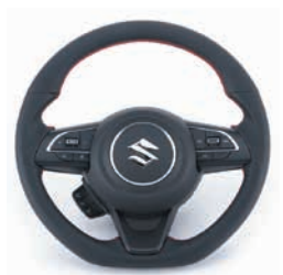
本革巻きステアリング スタンダードモデル

純正より若干太めの操作性重視の断面形状 で、優れた握り心地を実現。サムレスト形状も 最適化し快適性を向上。軽量・高剛性アルミ フレーム採用。JB64/74・JC74全グレード対 応、生地は本革仕様です。