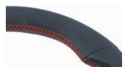
本革巻きステアリング レッドステッチ