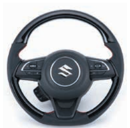
コンビネーションステアリング グロス ピアノブラック