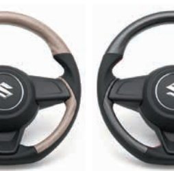
コンビネーションステアリング マット エボニー