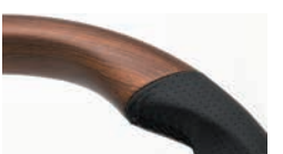
コンビネーションステアリング ブラックステッチ