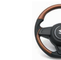
コンビネーションステアリング マット ウォールナット